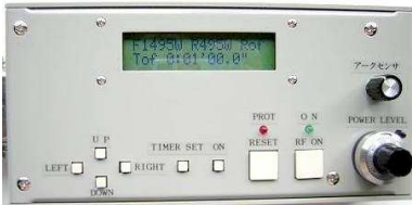
写真は7ヶ所の設定つまみ付の特別仕様品です